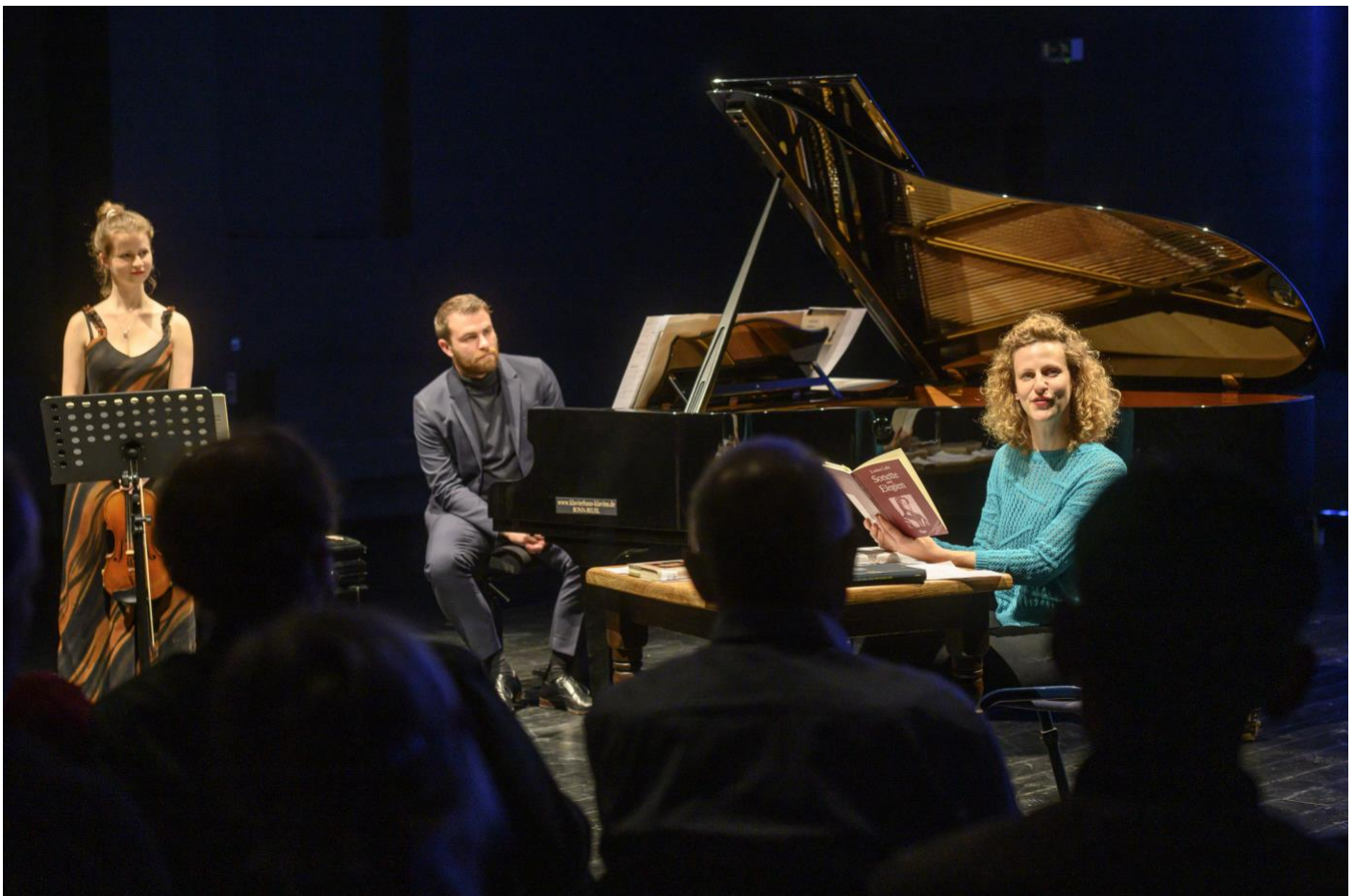
Eindrücke von der Premiere beim Schumannfest Bonn am 11. Juni 2019